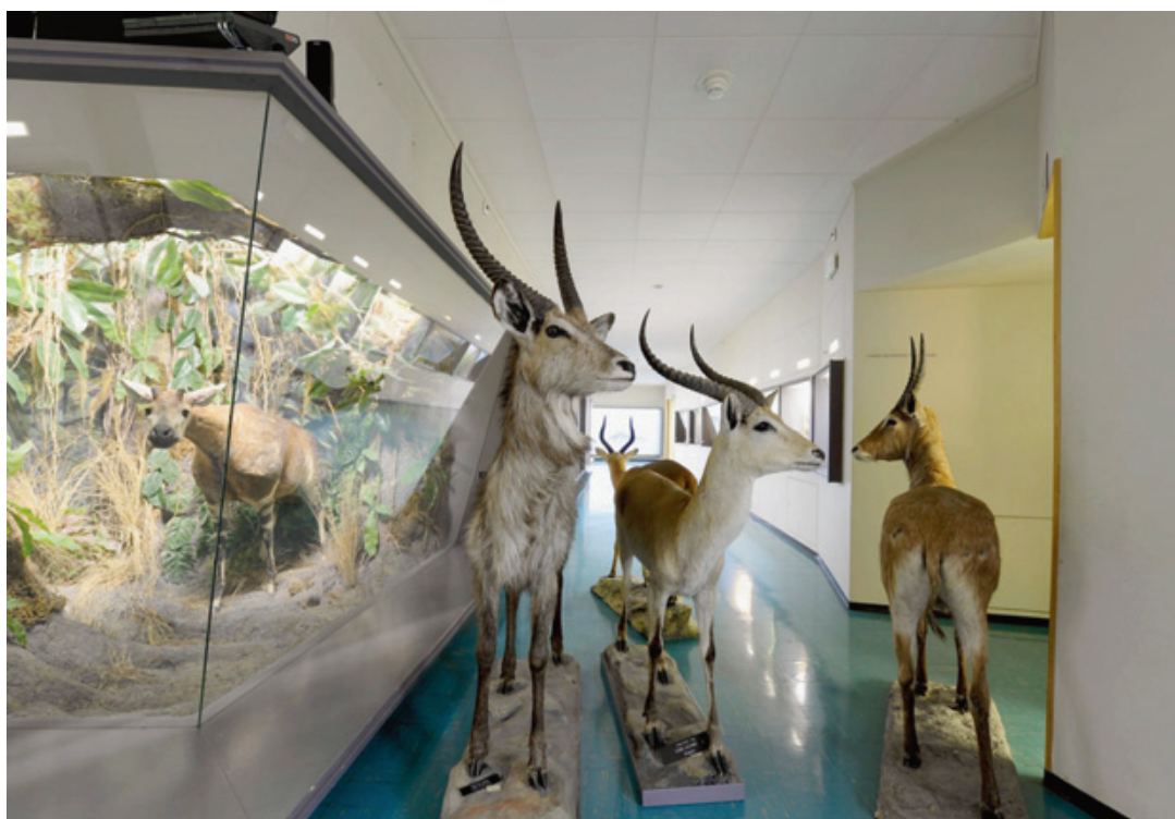
Rencontre inhabituelle au musée: un okapi dans le diorama et des antilopes africaines.